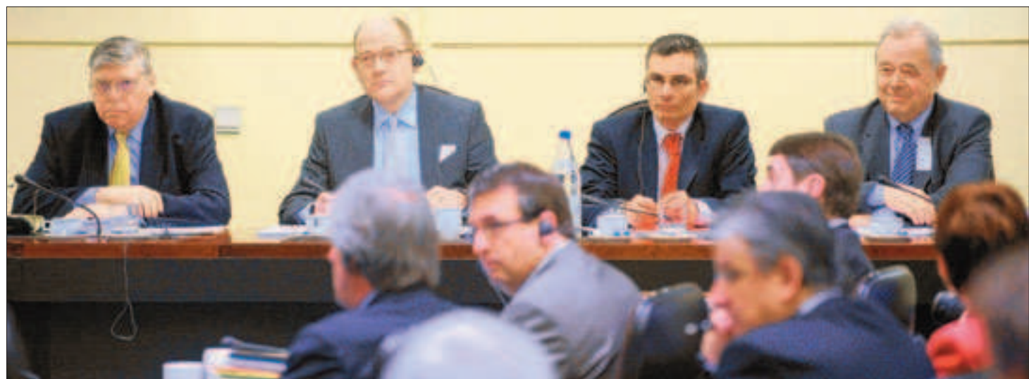
Les quatre experts universitaires chargés d'assister les députés ont été catégoriques : la commission Fortis ne peut pas poursuivre ses travaux.