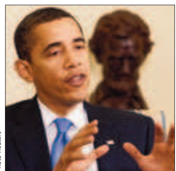
La crise met Obama sous pression.